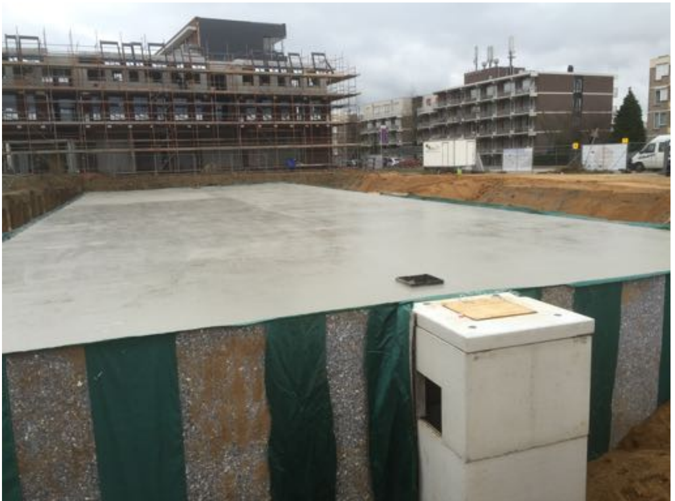
Foto gestort dek infiltratiekelder

Mocht hinder ontstaan, dan zullen wij serieus met uw opmerkingen, suggesties en klachten omgaan.